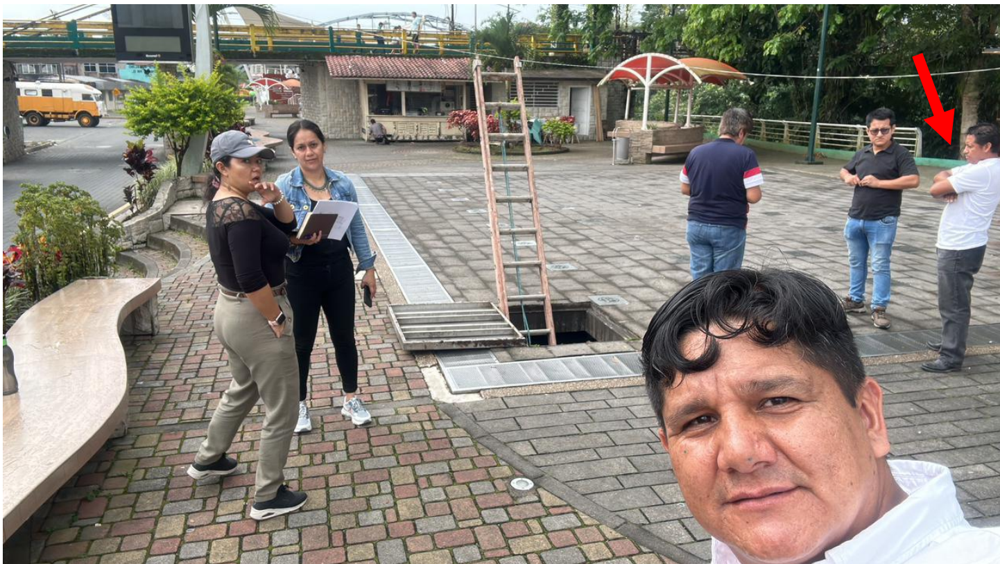
Presencia del ingeniero Supe en la inspección de la pileta rítmica