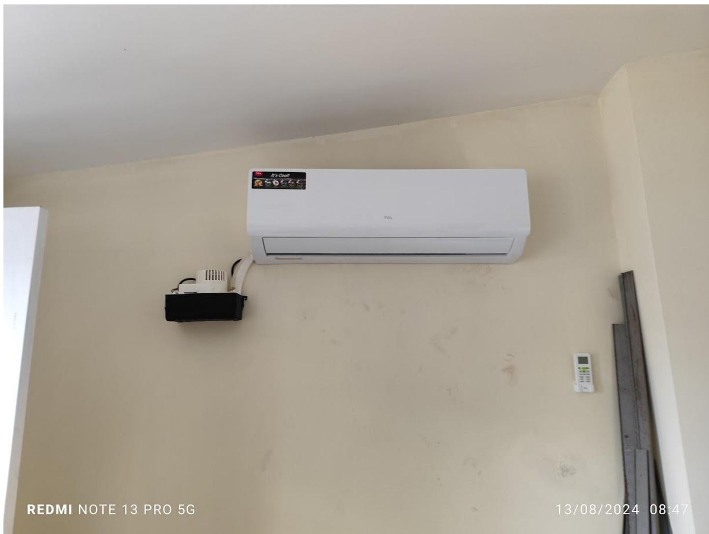
Verificación de rubros planilla 3